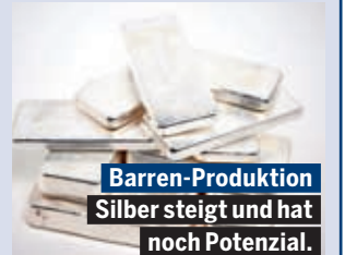
Barren-Produktion Silber steigt und hat noch Potenzial.

Weil Silber nicht nur eine Wertanlage ist, sondern auch in Zukunftstechnologien wie der Elektromobilität und im Bereich erneuerbaren Energien zum Einsatz kommt, sind weitere Kursanstiege in den nächsten Jahren sehr gut möglich.