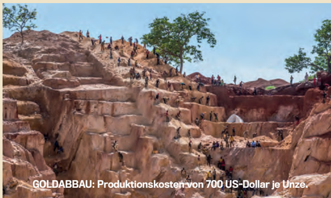
GOLDBBAU: Produktionskosten von 700 US-Dollar je Unze.